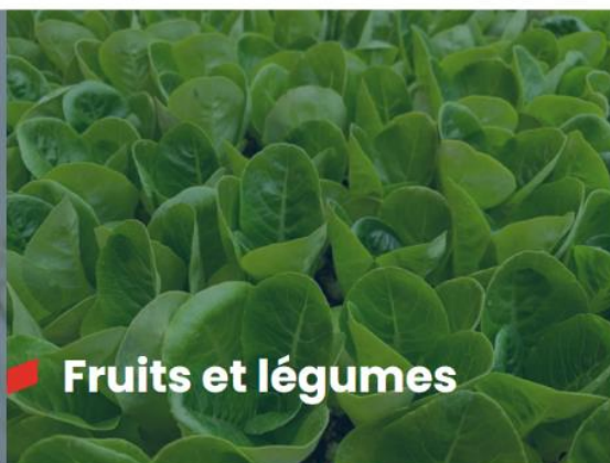
Fruits et légumes