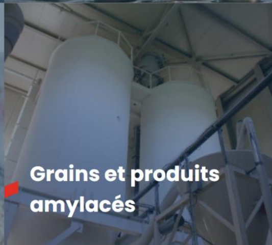
Grains et produits amylacés