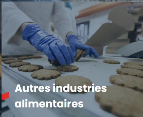
Autres industries alimentaires