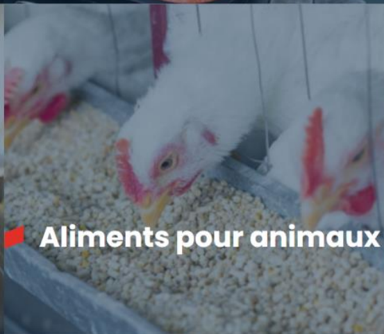
Aliments pour animaux